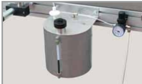
6,5 LİTRE PASLANMAZ ÇELİK MÜREKKEP TANKI