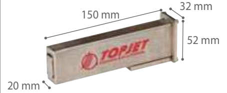
TEK NOKTA MODELİ (MONOJET) MODEL KT1

Mevcut karakter matrisleri: 5x5 nokta, 7x5 nokta, 9x7 nokta ve 16x10 nokta (farklı matrislerin bir kombinasyonu da mümkündür).