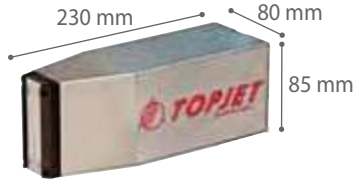
16-DOT YAZICI KAFA MODEL KT16

Mevcut karakter matrisleri: 5x5 veya 7x5 nokta (farklı matrislerin bir kombinasyonu da mümkündür)