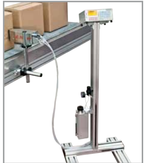
SADECE TANK VE KONTROL ÜNİTESİ İÇİN STAND