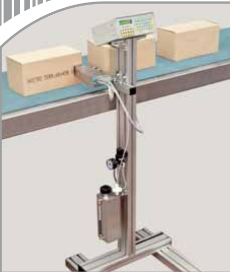
YAZICI KAFA, MÜREKKEP TANKI VE KONTROL ÜNİTESİ İÇİN STAND