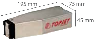
7-DOT YAZICI KAFA MODEL KT7